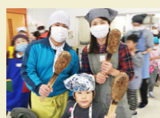
森町小学校の「収穫祭」にて。子供たちと共にひこぎさん作り。

新潟市より移住。前職はWebデザイナーで新潟県の観光サイトや某大学、大手自動車企業などのサイト作成・立ち上げに携わる。協力隊の任期終了後は下田地域での定住を目指す。