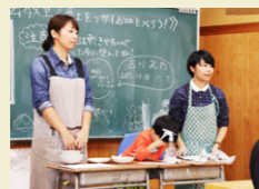
旧荒沢小学校の図工室を活用した陶芸教室の様子

横浜市出身。前職はスキンケアや雑貨を扱う販売員。退職を機に、職業訓練施設「ただ塾」に参加。4月から地域おこし協力隊へ。下田の魅力発見/発信中！